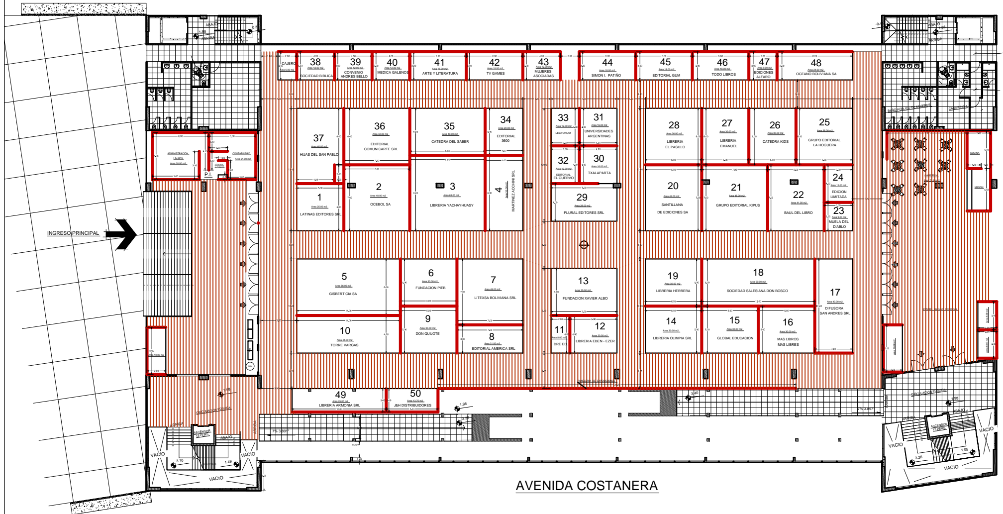
PLANTA BAJA DE EXPOSICION ESC. 1:100